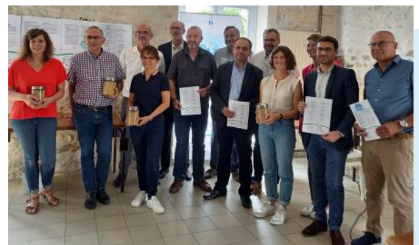
Les partenaires réunis pour la signature de la lettre d'engagement (2022)