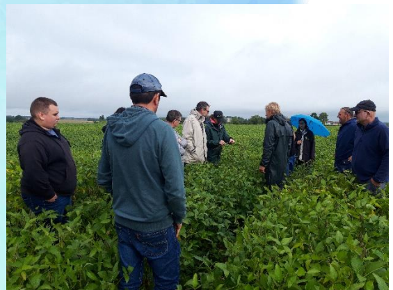
Tour de plaine des parcelles de soja avec les partenaires pour préparer la récolte – 31/08/23

Les besoins de Loué étaient de 230 à 270 tonnes par an, soit 100 ha. Afin de rendre la filière plus attrayante, Pasquier Vgt'Al et Loué ont proposé d'ajouter une prime au prix d'achat du marché, justifié par le caractère français, local, non-OGM et conforme à une charte de respect de la qualité de l'eau de cette filière.